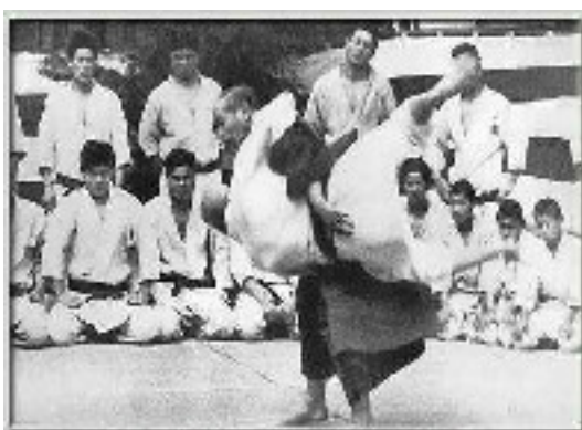
Jigoro Kano wirft Uki Goshi

JUDO ist ein Sport für alle; für Junge und Ältere, für Buben und Mädchen.