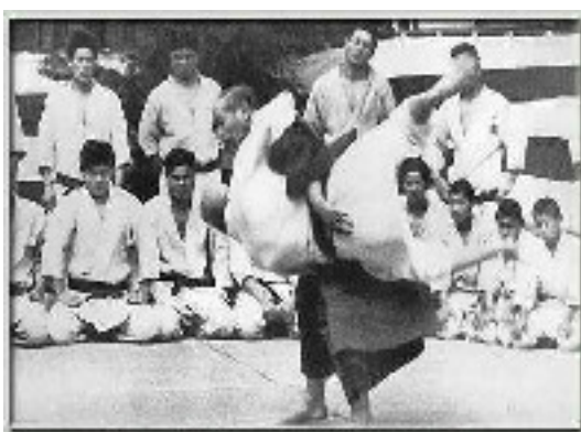
Jigoro Kano wirft Uki Goshi

JUDO ist ein Sport für alle; für Junge und Ältere, für Buben und Mädchen.